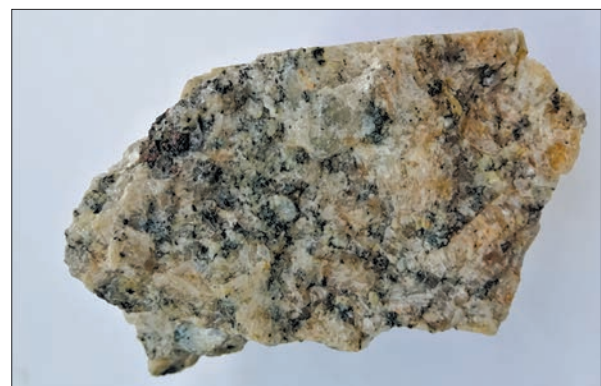
Рис. 1. Світло-рожевий порфіроподібний біотитовий граніт, Кіровоградський масив, пр. КВ-5-1, Соколівський кар'єр

Результати та їх обговорення. Граніт порфіроподібний (пр. КВ-5-1). Порода світла, сіро-рожева з крупнозернистою порфіроподібною структурою (рис. 1). Порфіроподібні виділен-