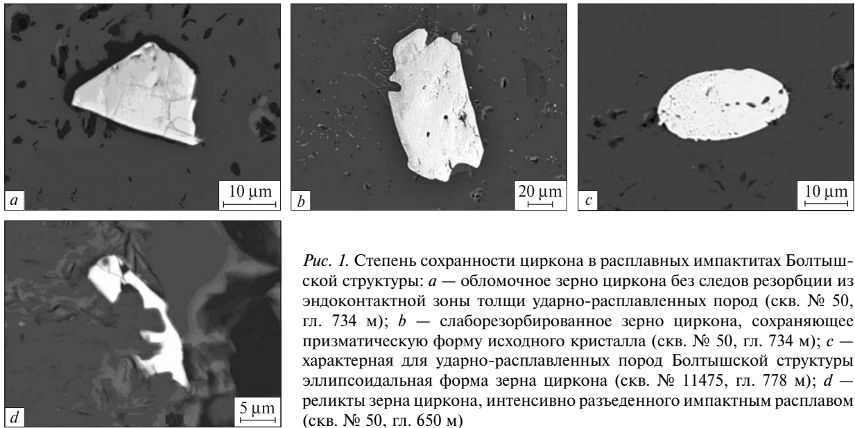
Рис. 1. Степень сохранности циркона в расплавных импактитах Болтышской структуры: a — обломочное зерно циркона без следов резорбции из эндоконтактной зоны толщи ударно-расплавленных пород (скв. № 50, гл. 734 м); b — слабрезорбированное зерно циркона, сохраняющее призматическую форму исходного кристалла (скв. № 50, гл. 734 м); c — характерная для ударно-расплавленных пород Болтышской структуры эллипсоидальная форма зерна циркона (скв. № 11475, гл. 778 м); d — реликты зерна циркона, интенсивно разъеденного импактным расплавом (скв. № 50, гл. 650 м)

Fig. 1. Preservation stage of zircon from impact melt rocks of the Boltysch structure: a — clastic grain of zircon without any traces of a resorption from the endocontact zone of impact melt sheet (borehole No 50, depth 734 m); b — weakly resorbed zircon grain that preserved prismatic shape of initial crystal (borehole No 50, depth 734 m); c — characteristic ellipsoidal shape of zircon grain from impact melt rock of the Boltysch structure (borehole No 11475, depth 778 m); d — relics of zircon grain, intensively resorbed by impact melt (borehole No 50, depth 650 m)