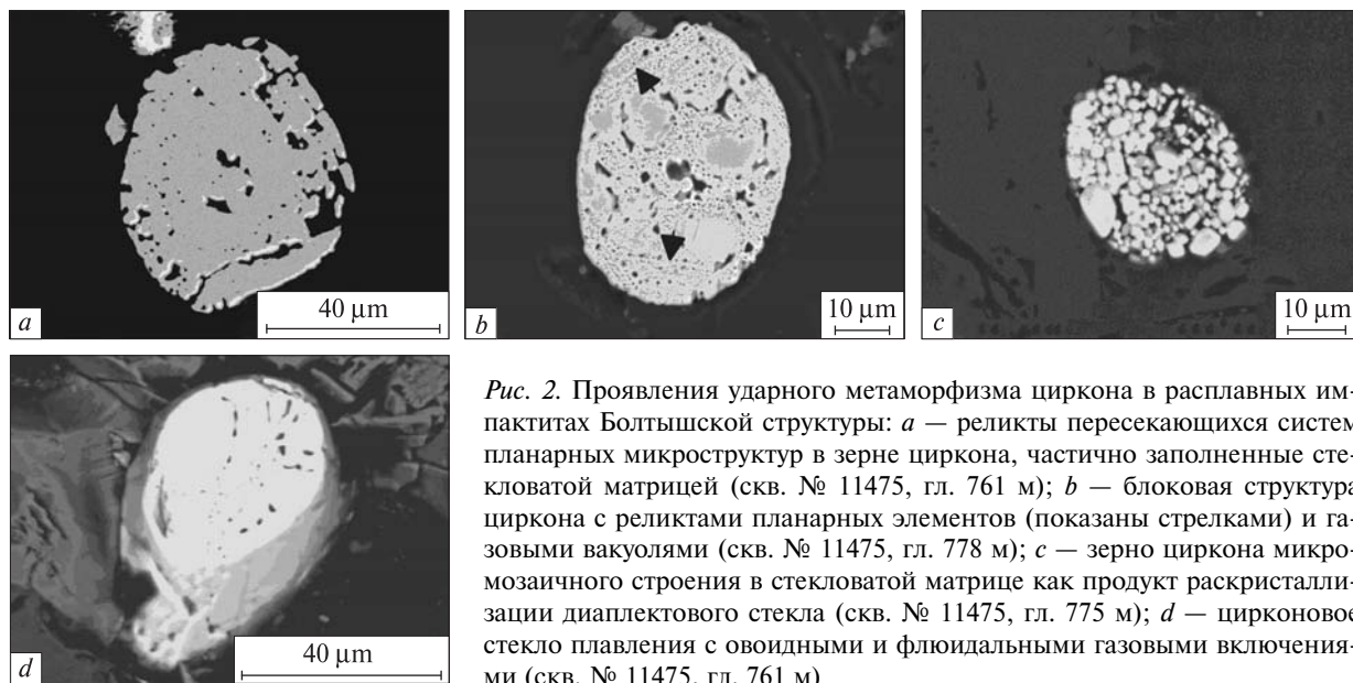
Рис. 2. Проявления ударного метаморфизма циркона в расплавных импактитах Болтышской структуры: a — реликты пересекающихся систем планарных микроструктур в зерне циркона, частично заполненные стекловатой матрицей (скв. № 11475, гл. 761 м); b — блоковая структура циркона с реликтами планарных элементов (показаны стрелками) и газовыми вакуолями (скв. № 11475, гл. 778 м); c — зерно циркона микромозаичного строения в стекловатой матрице как продукт раскристаллизации диаплектового стекла (скв. № 11475, гл. 775 м); d — цирконовое стекло плавления с оvoidными и флюидальными газовыми включениями (скв. № 11475, гл. 761 м)

Fig. 2. Manifestations of shock metamorphism of zircon from impact melt rocks of the Boltys structure: a — relics of intersected systems of planar microstructures in zircon grain are partially filled by a glassy matrix (borehole No 11475, depth 761 m); b — block structure of zircon grain with relics of planar microstructures (shown by arrows) and gas bubbles (borehole No 11475, depth 778 m); c — micromosaic grain of zircon in a glassy matrix as a product of recrystallization of diaplectic glass (borehole No 11475, depth 775 m); d — melted zircon glass with fluidal gas bubbles (borehole No 11475, depth 761 m)